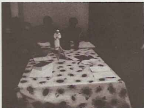
Diretoria Organizando a Festa

O cardápio constará de: galeto (coxa e sobre coxa), polenta com molho, arroz, saladas variadas e muito carinho por parte da equipe da Diaconia. O valor do ingresso é R$12,00 por pessoa. Maiores informações pelo telefone (51) 3044-7372.